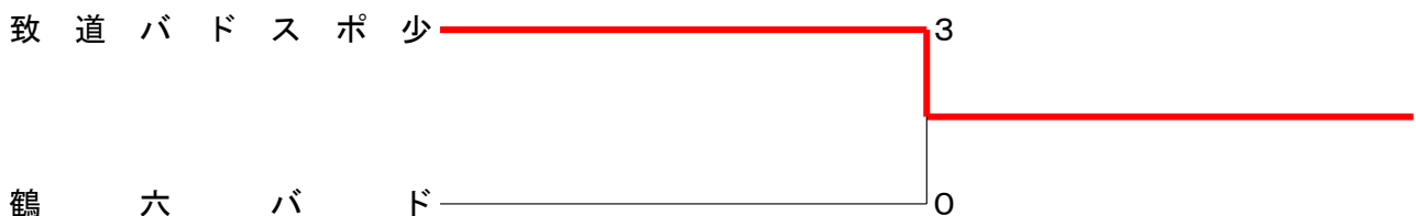
女子団体 決勝トーナメント